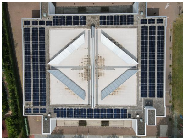
SE Saleggi – settembre 2023

Studio di fattibilità ed in seguito l'esecuzione dei seguenti impianti: Palacinema, Centro Tecnico Logistico, SI Gerre, Spogliatoi Morettina, Scuole Saleggi (SI e SE), Stadio, CPI e casa S. francesco > potenza tot. ca. 750 kW