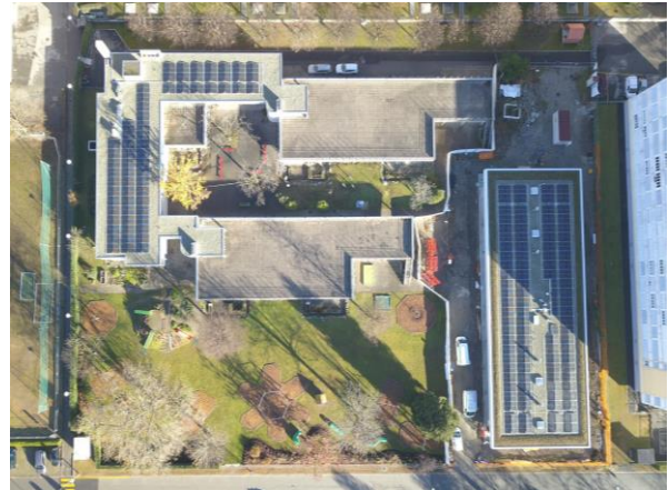
SI Saleggi – dicembre 2023