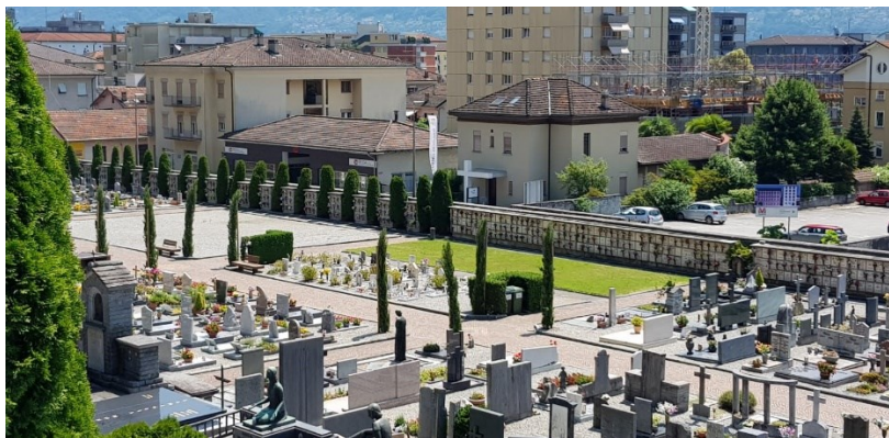
Spazio dove sorgeranno i nuovi loculi

Nello specifico si rende ora necessario un ampliamento dello spazio adibito ai loculi, resosi necessario dal fatto che rimangono pochissime cellette libere e dovendo anche tener conto che sempre piú persone optano per la cremazione a discapito della classica sepoltura. Il numero di nuove unitá previste é di 840.